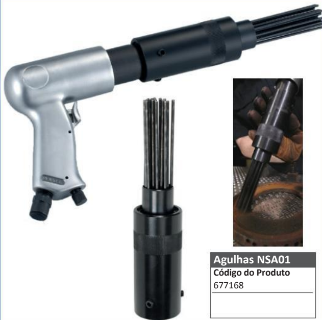
Agulhas NSA01 Código do Produto 677168